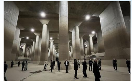
施設見学会（首都圏外郭放水路）