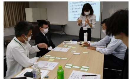
OneDay プレミアムセミナー