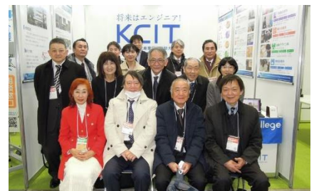
テクニカルショウヨコハマ