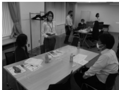
OneDay プレミアムセミナー

会員企業優良従業員表彰、施設見学会、セミナー、講演会など、会員企業の人材育成に資する取り組み、及び会員間の情報交換を目的とした交流会等を行っています。