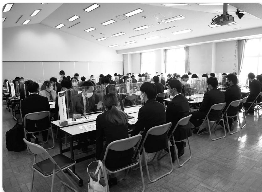
「職業能力開発情報交流会」令和4年3月9日、10日