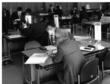
職業能力開発情報交流会

職業能力開発情報交流会（会員企業と学生相互の面談会）、短大校学生のインターンシップ受入れ、短大校教育訓練活動の支援（各種競技大会・各種表彰の補助等）やアニュアルレポート（推進協議会と短大校の事業年報）の発行、テクニカルショウヨコハマへの出展など、短大校が推進する教育訓練を支援しています。