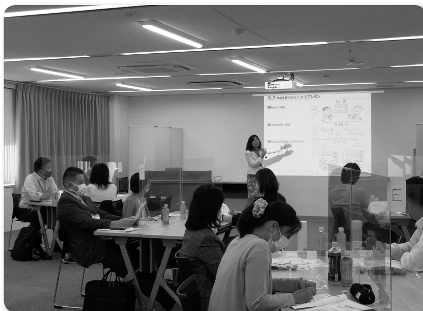
「OneDayプレミアムセミナー」令和3年10月11日