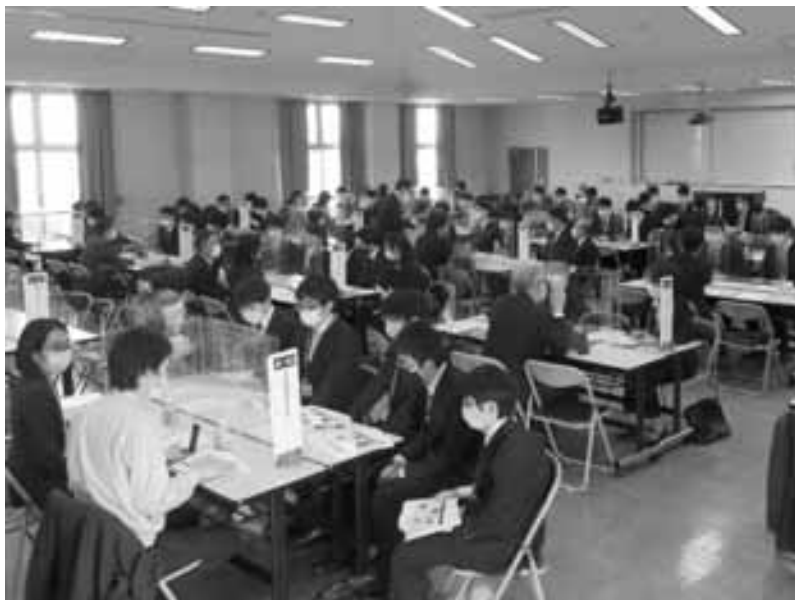
「職業能力情報交流会」 令和3年3月10日、11日