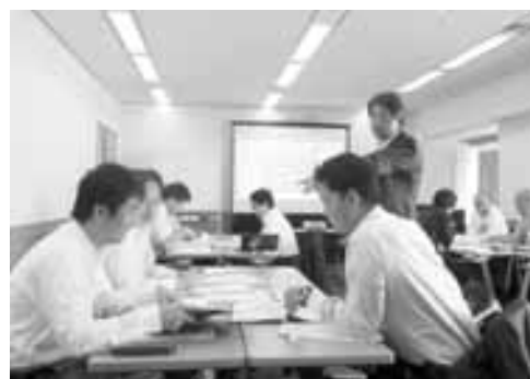
OneDayプレミアムセミナー