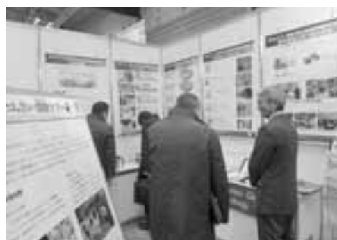
テクニカルショウヨコハマ出展