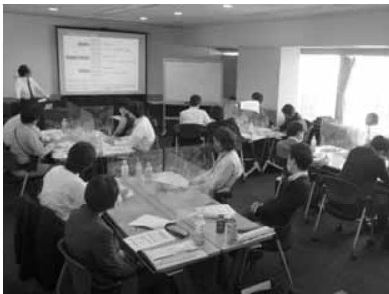
「OneDayプレミアムセミナー」 令和2年11月13日