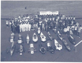
参加者と参加車両が全員集合

環境に配慮した省エネ技術の向上や、日ごろの研究成果の検証の場を提供する目的で、1リットルのガソリンでどこまで走れるかを競い合う「かながわエコカー競技大会」が、短大校が中心となって開催されています。推進協議会では開催趣旨に賛同し、第1回大会から支援を続けています。