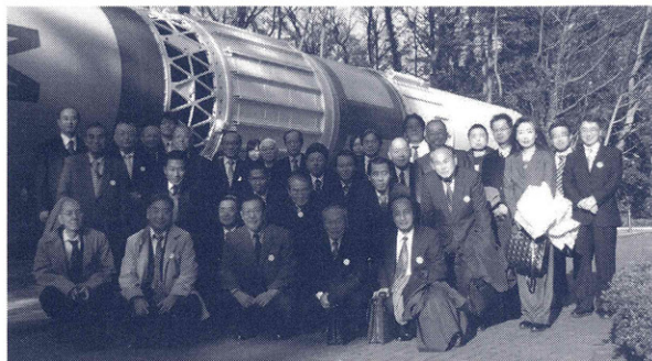
多くの科学衛星の打上げに使われているM-Vロケットの前で

推進協議会では、会員企業の今後の技術開発や事業展開にお役に立てていただくため、毎年1回、企業等の研究機関や技術展示施設などを視察する「先端施設見学会」を開催しています。今年度は、12月15日(木)、相模原市中央区にあるJAXA宇宙航空研究開発機構・相模原キャンパスを視察しました。