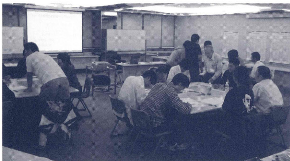
グループワークに取り組む研修生の皆さん

会員企業の従業員の皆様を対象に、職場の活性化と組織力の向上を目指した「リーダー養成研修」を年2回開催しています。