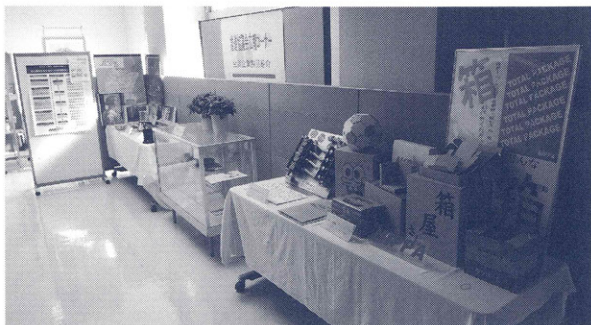
会員企業の製品を紹介する推進協議会広報コーナー

短大校の学生や来校された県民・企業の皆さんに、会員企業の事業内容や製品のPRをするため、短大校の正面玄関入り口付近に推進協議会広報コーナーを開設しました。現在までに6社21製品の展示実績がありました。今後とも、展示内容を充実させていきたいと考えておりますので、製品のご提供をお願いいたします。また、ソフト開発会社などについては、パネル展示で事業内容をご紹介させていただくことも考えておりますので、是非、事務局までご相談ください。